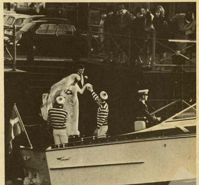
Annie bliver fundet, og Christian narrer vægen ved at gifte sig med hende. Men hvad betyder det for Annie? På bryllupsnatten, Anders synger serenade nede for vinduerne, spørger først han og derefter Christian: »Hvis er du?«, og Annie svarer med en lille smil: »Jeg er sgu min egen«.