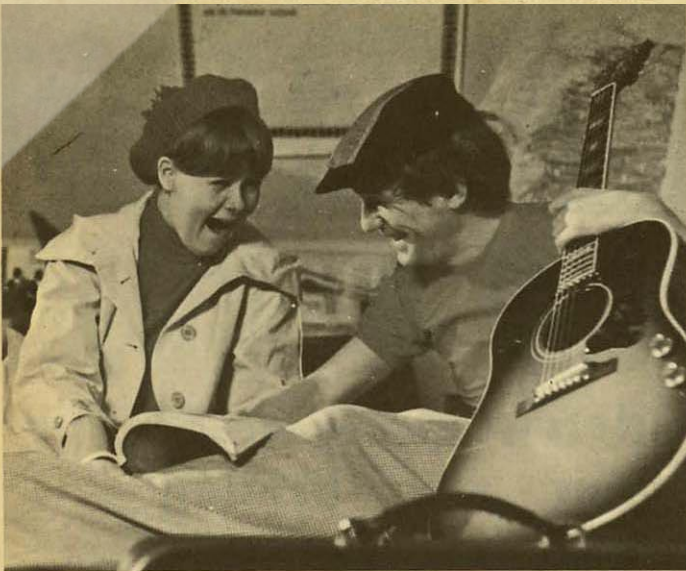
Hun søger tilflugt hos popsangeren Anders (Cæsar), som hun allerede lærte at kende ved det store slagsmål, som førte til hendes fængsling. De har det pragtfuldt sammen, men ...