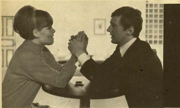
Annie ser som sin eneste udvej at udnytte sit bekendtskab med Christian (Peter Steen), som for det første er en overordentlig pæn fyr, for det andet fuld af penge og endelig arving til et stort gods. Han inviterer Annie til rævejagt på godset.