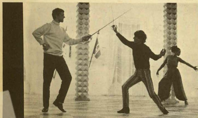
Uheldigvis er det netop Anders' orkester, der skal spille til det efterfølgende bal. Han og Christian kommer op at slås, først med de bare næver, men derefter på kårde. Mens de slås forsvinder Annie, og så må hele selskabet ud og lede efter hende.