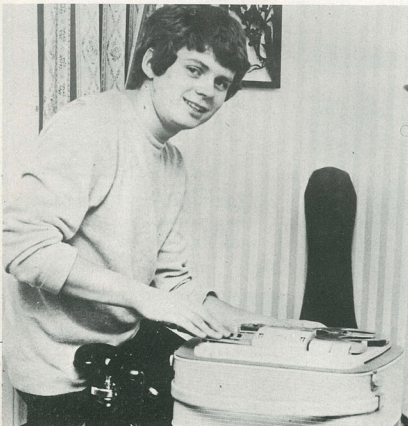
Jens bad os lade være med at fortælle adresse og tlf.-nummer