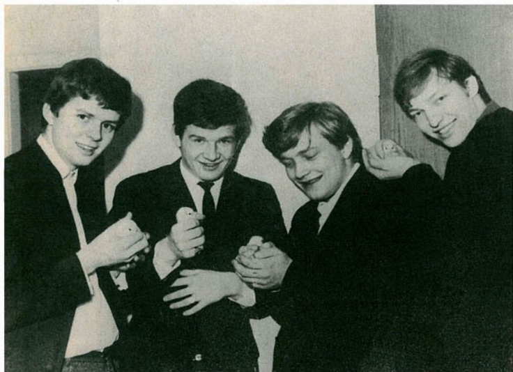
De fire Defenders med hver sin kylling, der kun er en dag gammel. På »Hansemands« farm var der lige udruget 10.000 kyllinger den dag.