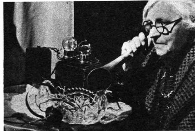
Engang måtte man have hørerøret til hjælp, hvis man ville høre radiø.