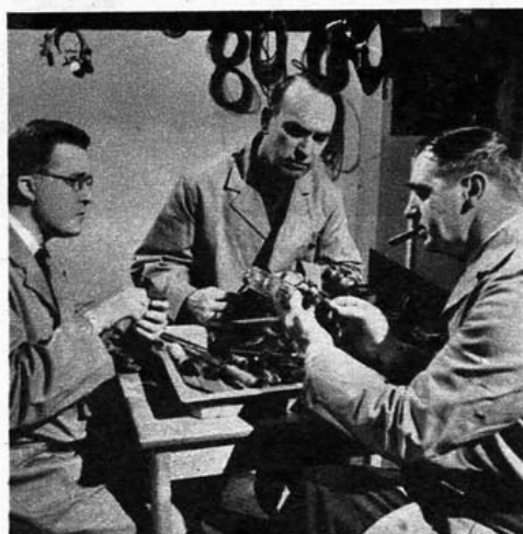
I radioens barndom sad teknikerne på vagt, for rørene var skrøbelige.

— Prisen? — Jeg kender den ikke. Jeg har sammensat et program og fået det godkendt. Men regningens størrelse kender jeg ikke. H.M.